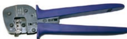
Alicates de engarce PV-CZM-16100A (2,5 / 4 / 6 mm 2 )