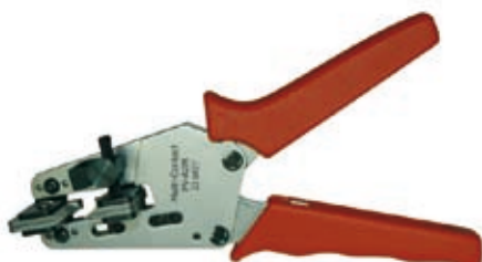
Alicates pelacables PV-AZM (1,5 / 2,5 / 4 / 6 mm 2 )